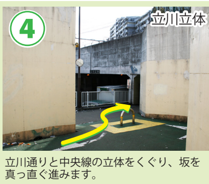
4 立川立体 立川通りと中央線の立体をくぐり、坂を真っ直ぐ進みます。