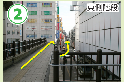
2 東側階段 階段を下りて真っ直ぐ進みます。左側に郵便局、右側にルミネがあります。