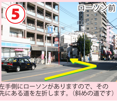
5 ローソン前 左手側にローソンがありますので、その先にある道を左折します。(斜めの道です)