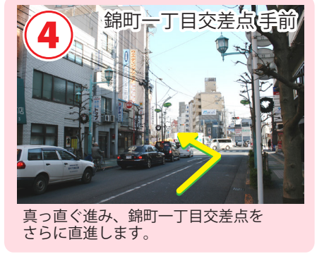
4 錦町一丁目交差点手前 真っ直ぐ進み、錦町一丁目交差点をさらに直進します。