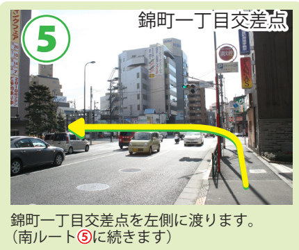
5 錦町一丁目交差点 錦町一丁目交差点を左側に渡ります。(南ルート⑤に続きます)