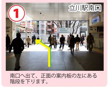
1 立川駅南口 南口へ出て、正面の案内板の左にある階段を下ります。