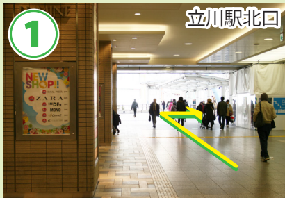
1 立川駅北口 北口からデッキへ出てすぐ右に向かいます。

立川駅北口→TDS 距離：1.1km 時間(4.8km/h)：13分 歩数：1350歩 消費カロリー 53 kcal おにぎり 0.3個分