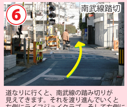
6 南武線踏切 道なりに行くと、南武線の踏み切りが見えてきます。それを渡り進んでいくと左側にライフジョイクラブ、そして右側に教習所の建物が見えてきます。

立川駅南口→TDS 距離：0.9km 時間(4.8km/h)：12分 歩数：1170歩 消費カロリー 49 kcal おにぎり 0.3個分