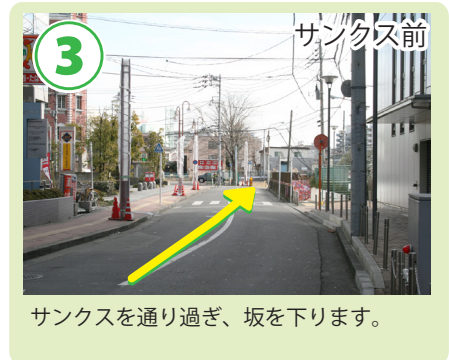
3 サンクス前 サンクスを通り過ぎ、坂を下ります。