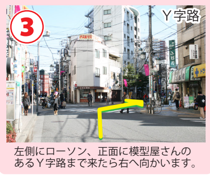
3 Y字路 左側にローソン、正面に模型屋さんのあるY字路まで来たら右へ向かいます。