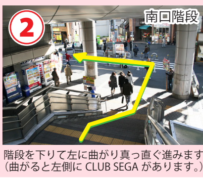
2 南口階段 階段を下りて左に曲がり真っ直ぐ進みます。(曲がると左側に CLUB SEGA があります。)